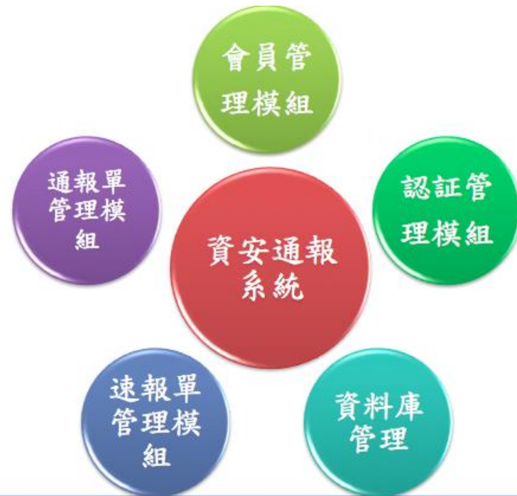
圖1 「證券期貨市場資通安全通報系統」架構圖